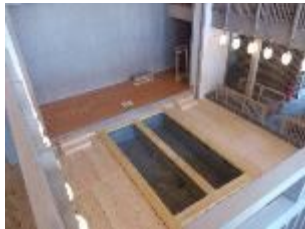
2階からみた1階部分